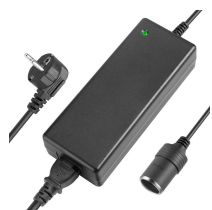
TRANSFORMATEUR 220V AC/12V DC 10A AVEC PRISE ALLUME-CIGARE FEMELLE