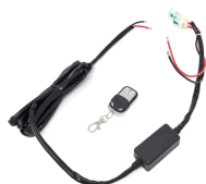
TÉLÉCOMMANDE ON-OFF POUR COMMANDE À DISTANCE D'APPAREILS ÉLECTRIQUES