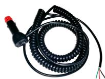
PRISE ALLUME-CIGARE AVEC CÂBLAGE POUR LM400, LM500, LM800