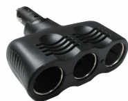
MULTIPRISE ALLUME- CIGARE 3 SORTIES 12V